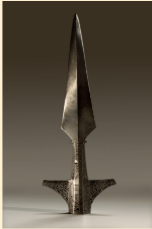
Jagdspießßeisen Herzog Friedrich IV. Spiedo da caccia del duca Federico IV 1430, Kunsthistorisches Museum Wien, Hofjagd- und Rüstkammer, Wien / Vienna

den kriegerischen Ereignissen in Appenzell erzählt, als dem jungen Herzog sein Besitz streitig gemacht wurde. Folgeschwer erwies sich die Schutzfunktion Friedrichs über den Gegenpapst Johannes XXIII., die ihm die Acht des Königs einbrachte und ihn vorübergehend „mit leeren Taschen“ dastehen ließ. Friedrich verlegte seine Residenz von Meran nach Innsbruck, gründete den Hof unter den Bürgern, stellte sich vehement gegen den ihn bekämpfenden Adel. So zwang er den mächtigen Heinrich von Rottenburg in die Knie, ließ mit Kanonen die den Starkenber-