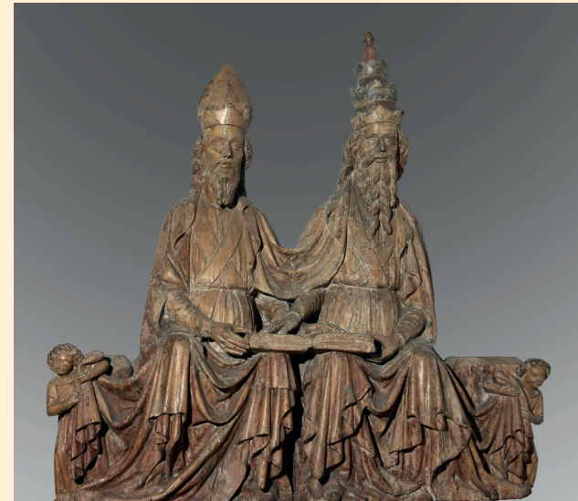
Thronender Papst und thronender Bischof Papa e vescovo in trono Salzburger Bildhauer / scultore salisburghese, ca. 1420, Dommuseum Salzburg / Salisburgo