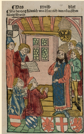
Richental-Chronik La Cronaca di Richental Anton Sorg, Augsburg / Augusta 1483 Bibliothek des Priesterseminars Brixen Biblioteca del Seminario maggiore Bressanone

I l duca Federico IV d'Austria (1382–1439) soprannominato “Tascavuota” non fu affatto indigente e privo di mezzi. Con la sua politica pose il Tirolo al centro di avvenimenti di portata europea. Durante il suo governo lo sfruttamento delle miniere e l'impulso al commercio favorirono la fioritura economica. La mostra tratta le tematiche centrali nella vita dell'Asburgo, approfondendo la cultura memoriale nutrita di mito e leggenda, nonché gli eventi bellici di Appenzello, scaturiti dalla contesa attorno ai possedimenti del giovane duca. Gravidia di conseguenze fu la protezione che Federico garantì al papa Giovanni XXIII: ne derivò il bando da parte del futuro imperatore e, temporaneamente, le “tasche vuote” per il duca. Federico trasferì la sua residenza da Merano a Innsbruck, istituendo così la sua corte tra i cittadini, e opponendosi con vigore alla nobiltà a lui ostile. In tal modo schiacciò il potente Enrico di Rottenburg, assediò il castello di Greifenstein appartenente agli Starkenberg e si intromise negli affari secolari dei vescovi. Con Hans Wilhelm von Mülinen coltivò una profonda amicizia, che prese forma anche tramite accordi e committenze artistiche. Federico non ebbe particolare sensibilità