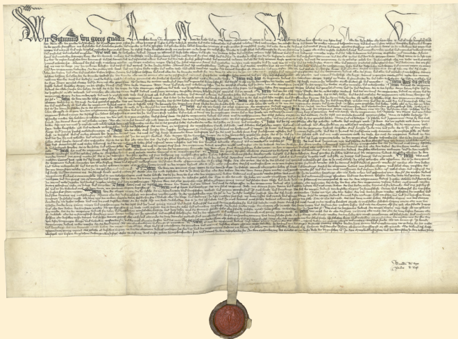
König Sigismund nimmt Herzog Friedrich von Österreich wieder in Gnaden auf Il futuro imperatore Sigismondo riaccoglie il duca Federico d'Austria nelle sue grazie Konstanz, 10. Mai 1418 / Costanza, 10 maggio 1418, Österreichisches Staatsarchiv, Abteilung Haus-, Hof- und Staatsarchiv, Wien / Vienna