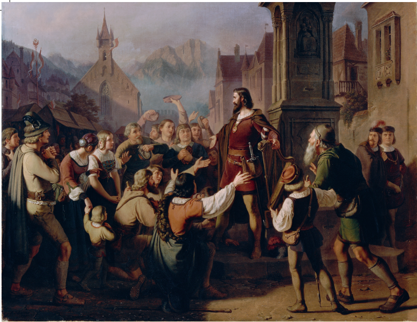
Der als Minnesänger verkleidete Herzog Friedrich IV. gibt sich auf seiner Flucht aus Konstanz seinen treuen Tirolern zu erkennen Il duca Federico IV, vestito da Minnesänger durante la fuga da Costanza, rivela la sua identità ai suoi fedeli tirolesi Franz Schams, 1851, Belvedere, Wien / Vienna

Herzog Friedrich IV. von Österreich (1382–1439), benannt „mit der leeren Tasche“, stand nicht arm und mittellos da. Durch seine Politik förderte er eine prosperierende Entwicklung, die Tirol zu einem der begehrtesten Länder im Herzen Europas machte. Bergbau und Handel brachten den wirtschaftlichen Aufschwung. Die Ausstellung geht den zentralen Themen im Leben des Habsburgers nach. Beleuchtet wird die Erinnerungskultur, die aus dem Mythos und der Sagenwelt schöpft. Zudem wird von