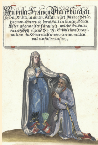
Teilkopie des „Wiltener Votivbildes“ Copia parziale dell' "Immagine votiva di Wilten" in: Matthias Burgklechner, Tirolischen Adlers Erster Theil, Zweite Abteilung, 1619